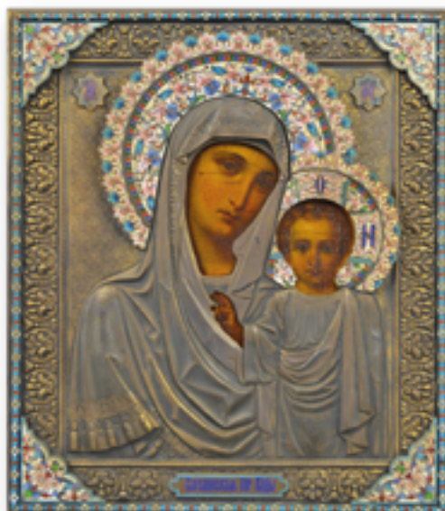
Silberkladikone "Gottesmutter von Kasan"

Sollten Sie nach sechs Wochen keine Nachricht von uns erhalten haben, bitten wir Sie, uns zwecks Rücknahme oder Reduzierung des Limitpreises zu kontaktieren.